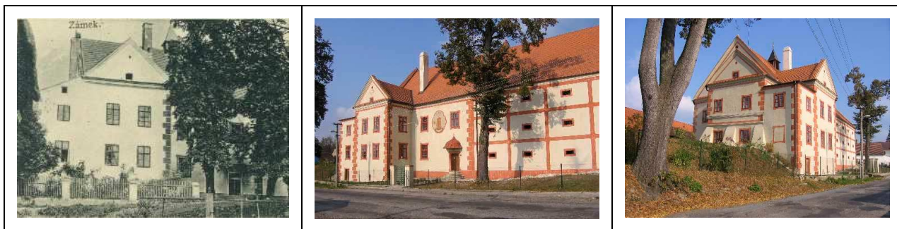
Ostrolovský Újezd na pohlednici z roku 1920