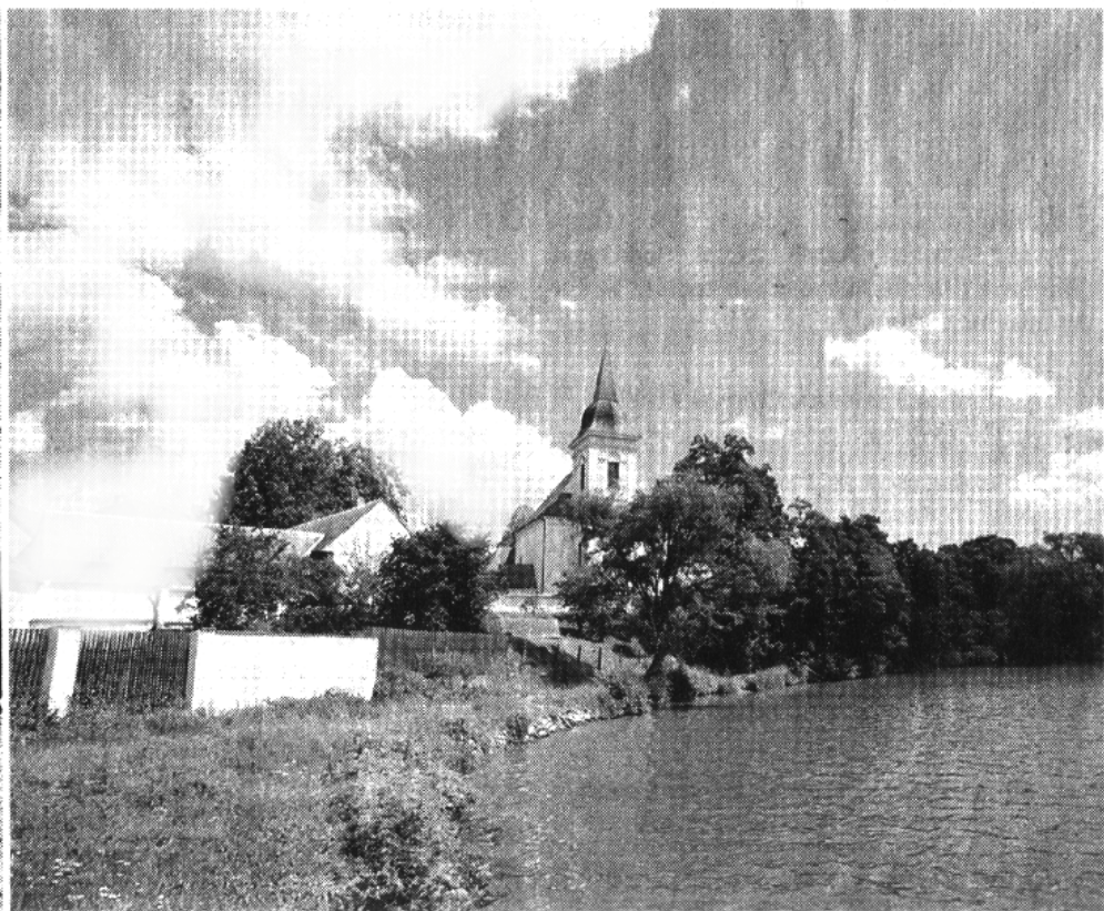
Slavný bošilecký mostek, o němž se zpívá ve známé písničce, dodnes stojí a nedávno byl opraven. Ovšem nejen mostek patří ke zdejšími atrakcím. Za to nejceněnější, co Bošilec má, považují památkáři místní kostel, jehož kořeny sahají až do 13. století

jsou až z poloviny století následujícího. Zato byly od té doby vedeny pečlivě a najdou se v nich zprávy půvabně praktické i vznešené.