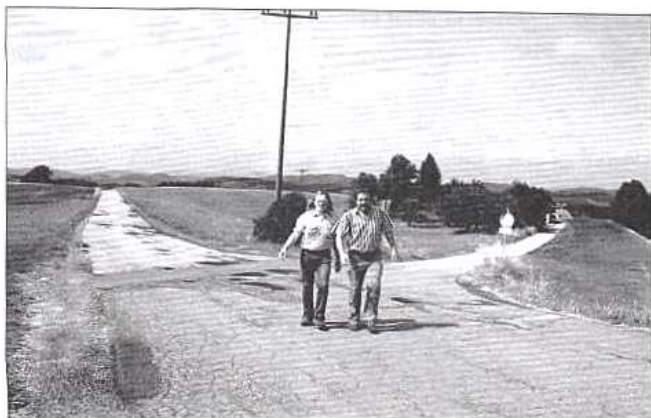
Obr. 2. V místě spojení všech tří větví Zlaté stezky pod Vendelsbergem v roce 2011. Abb. 2. Auf der Stelle unterhalb von Vendelsberg, wo alle drei Zweige des Goldenen Steiges zusammenlaufen, im Jahr 2011.