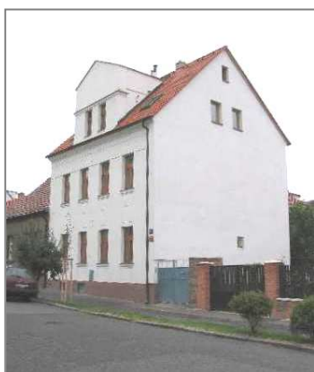
Dům V Nových Vokovicích 136/13., snímek (2005) z rodinného archivu.

Prádlo se pralo nejlíp v pátek a sobotu. Na praní i na koupání jsme měli malou zinkovou vanu. Nejdřív se prádlo přes noc namočilo do sodného roztoku a druhý den se na mokřích kusech ještě mydlily límečky a rukávy. Pak přišly ke slovu jádrové mýdlo, rejžák a valcha, potom nekonečné máchání. To bylo nějakých kbelíků vody! Naposled uvařit škrob a vybrané věci přiškrobit, zvláště ložní. Pak se šlo věšet, to přišel ke slovu maminčin vynález zvaný praktikol - velká praktická kapsa na kolíky v podobě zástěry.