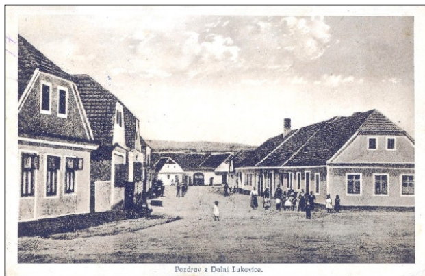
Pozdrav z Dolní Lukavice.