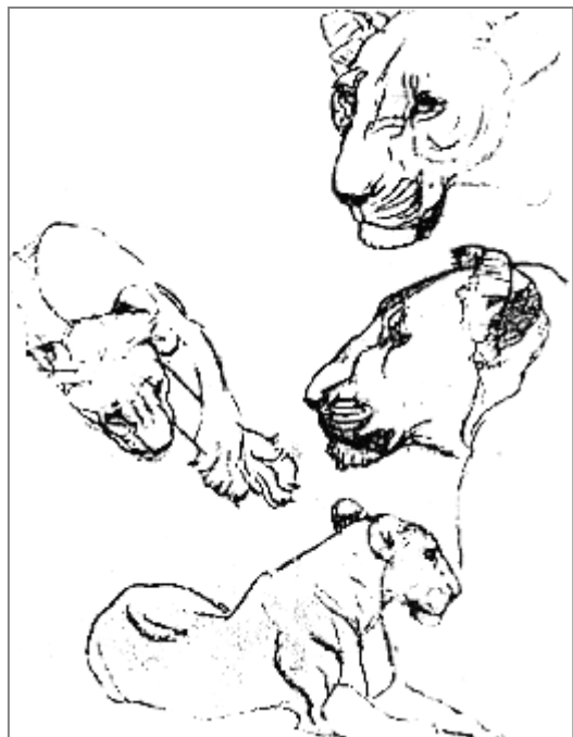
Kresba Joy Adamson