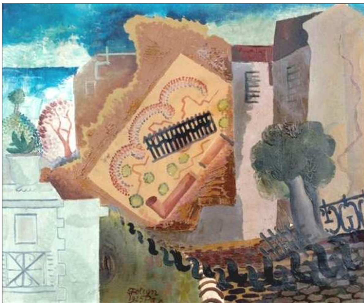
Jedna pařížská ulice. Olej 60 x 73 cm, Paříž 1925