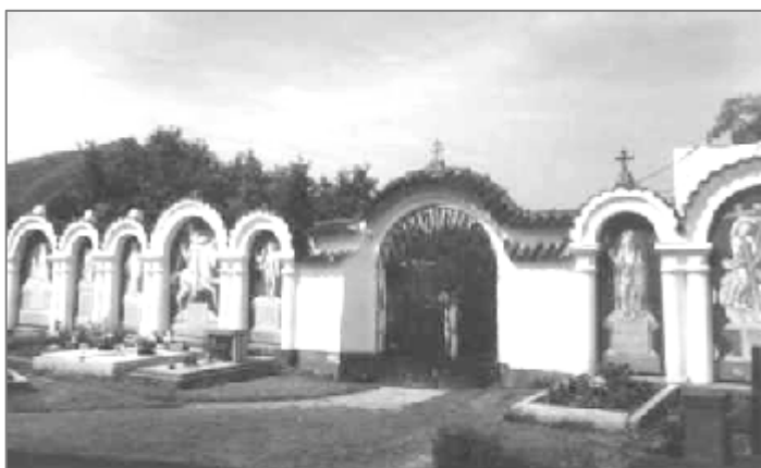
Část hřbitovního areálu v Albrechticích nad Vltavou. Pohled k vnitřní straně vchodu, stav v květnu 1997.

Při jedné z návštěv Albrechtic jsem prošel již otevřenými hřbitovními vraty, a proto jsem je nezavřel. Od přicházejícího kostelníka se mi dostalo dosti důrazného poučení, že jsem tak měl učinit. Díky tomuto úvodu jsem se však mohl seznámit nejen s kostelníkem, ale následně i s chrámovým interiérem a zakoupit si publikaci věnovanou kostelu sv. Petra a Pavla