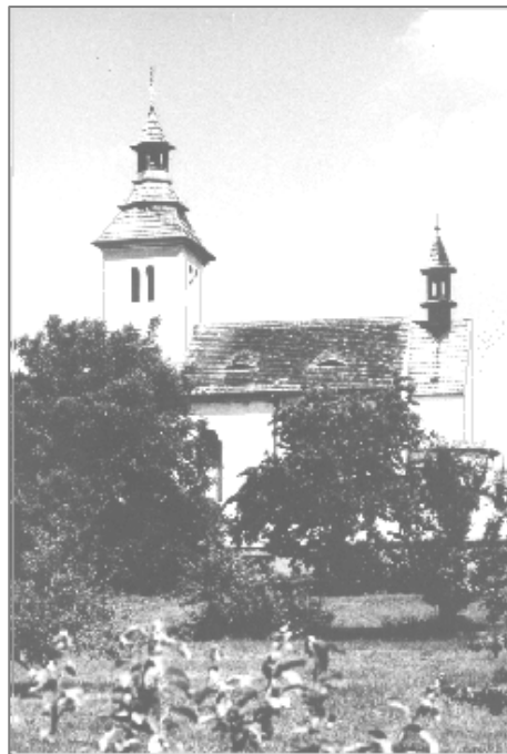
Románský kostel sv. Petra a Pavla v Albrechticích nad Vltavou

Člověk míní, Pán Bůh mění, tak se často stávává. Že míníme to, neb ono, vůli naší měnívá. Nebožtík ten ještě ten den chtěl do Prahy vyplouti, Z pramene si zašel domů, potravu si nabratí. Již na cestě cítil těžkost, přijda domů upadnul, Průjem horem, dolem dostal, křečem hrozným podlehnul. Než lékařská pomoc přišla, již byl celý zmodralý, Zaopatřen byv svátostmi, byl zničen od cholery. Místo Prahy musel plouti do oborů věčnosti, Bože! přijmiž ho na milost, uděl věčné radosti. Protož bděme ve dne v noci, nevíme dne hodiny. Kdy si na nás smrt zakývá, pojme v věčné dědiny.