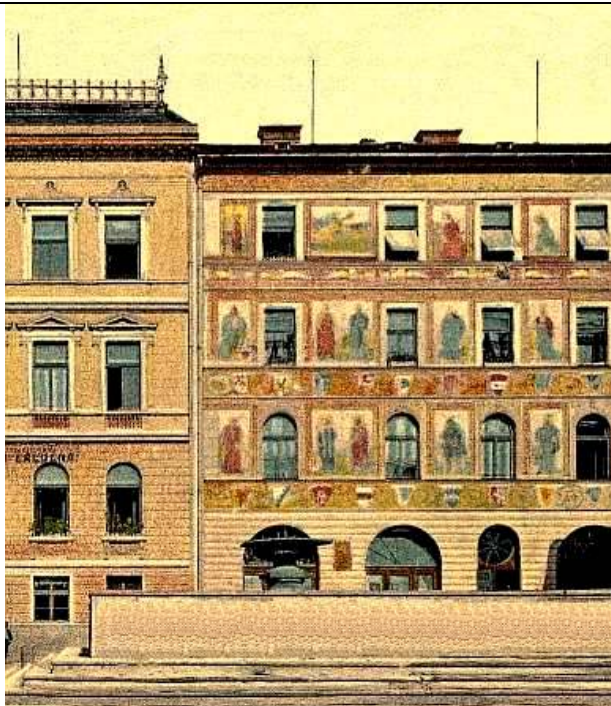
Nakl. Josef Hanek, Jindřichův Hradec. Pošt. razítko 1909.

Autorovi děkujeme za poskytnutí téhož textu do RR on-line. V obrazové příloze jsou digitálně upravené výřezy pohlednic ze soukromé digitální sbírky, darované v roce 1998 archivu Rodopisné revue.