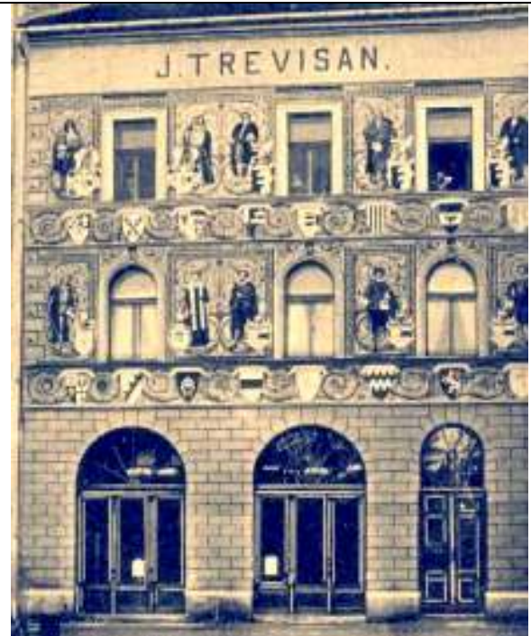
Nakl. Antonín Landfras, podoba domu ještě dvoupatrového, před rokem 1902.