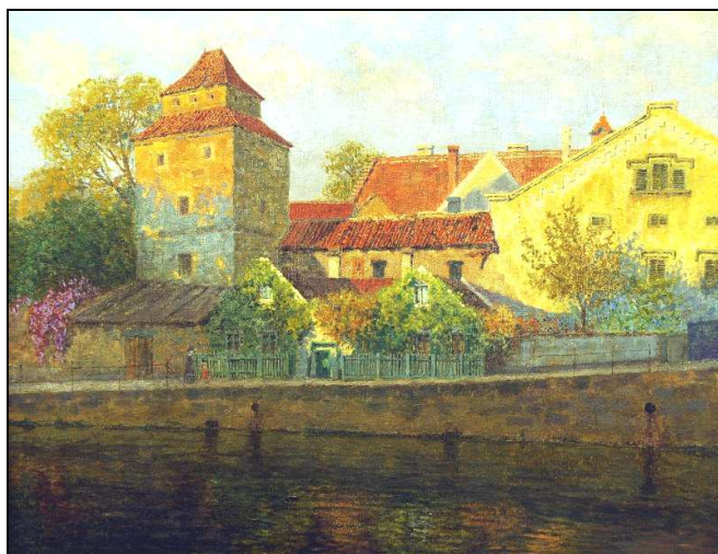
Václav Jansa: Věž zvaná Železná panna v Č. Budějovicích. Olejomalba na plátně 51.5 x 64.5, nedatováno, 2. polovina 19. stol.

Václav Jansa: Stárkův dům v Táboře. Zvláštní příloha Zlaté Prahy, nákladem J. Otty v Praze. Zlatá Praha. Obrazový týdeník pro zábavu a poučení. Ročník 26, 1909, č. 22, dne 19. února 1909. Vloženo mezi s. 260-261.