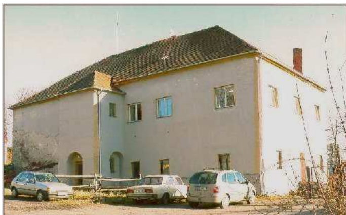
Dřešíněk čp.1, bývalý zámek. Takto dopadl po přestavbě, provedené roku 1977 dřešíňským JZD Šumava. Fotografie autor 13. 1. 2015.