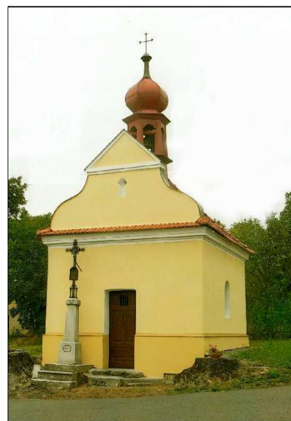
Návesní kaple z 1. poloviny 19. století v Dřešínsku.