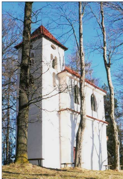
Dobrš, románský kostelík sv. Petra a Pavla. Oba snímky pořídil autor 13. 1. 2015.