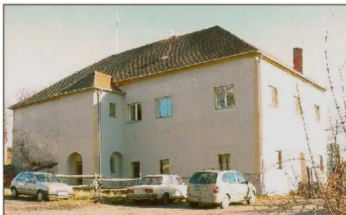
Dřešíněk čp.1, bývalý zámek. Takto dopadl po přestavbě, provedené roku 1977 dřešínským JZD Šumava. Fotografie autor 13. 1. 2015.