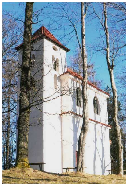
Dobrš, románský kostelík sv. Petra a Pavla. Oba snímky pořídil autor 13. 1. 2015.