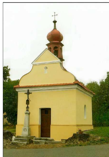
Návesní kaple z 1. poloviny 19. století v Dřešíňku. Fotografie autor 8. 8. 2013.