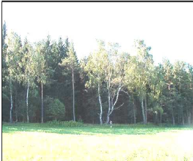
Foto 2013, kdy můj syn stojí před někdejší mýtinkou.