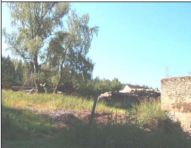
Zprava je v záběru zbytek obvodové zdi mlýnské usedlosti č. 25, v pozadí je střecha domu č. 24 a za ním je na obzoru vidět přerostlá bříza na někdejší mýtince.