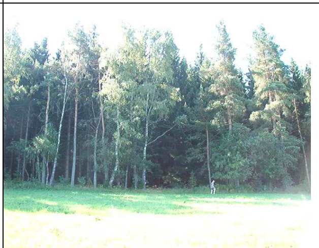
Nižší náletový porost a plevelné břízy zřetelně dokládají malý, kdysi pro sruby vykácený prostor.