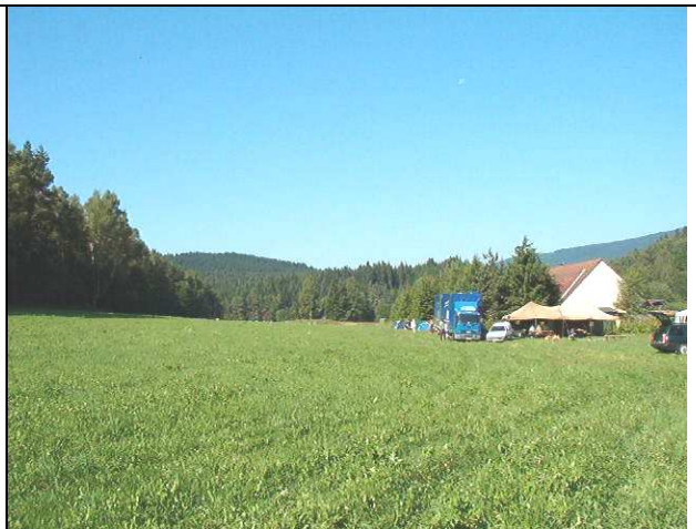
Od hranice lesa k domu č. 24 je to cca 100m.