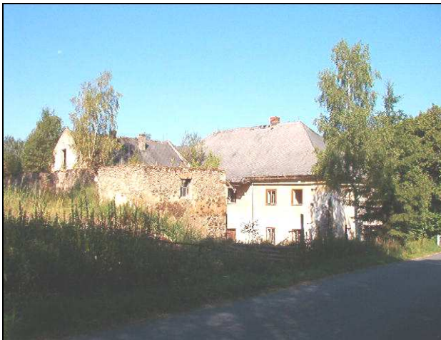
Blanický - Pauleho mlýn č. 25 patří k obci Blažejovice.