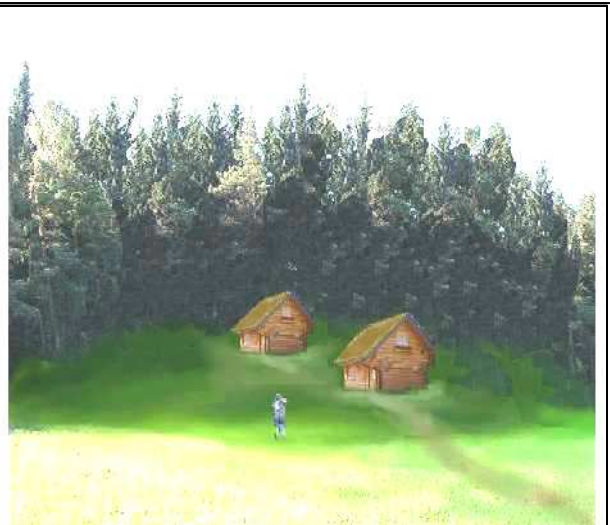
Rekonstrukce stavu v r. 1949, náš domek je v popředí.