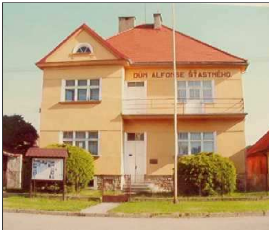
Padařov, okres Tábor. Dům Alfonse Šťastného postavený v letech 1934 – 1936. Foto 16. 8. 2013.