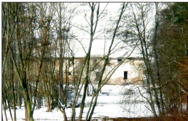
Nahoře je záběr na údolí Cikánského potoka, pohled od Hamru k Dobišovu mlýnu. Foto 8. 4. 2013.