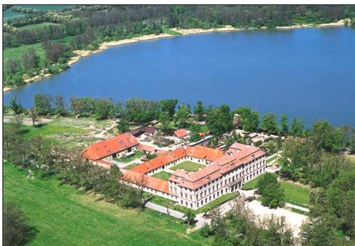
Celkový pohled na areál zámku Ohrada s Munickým rybníkem