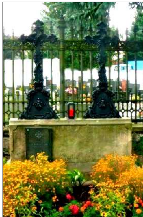
Hrob. 14/ 15 - viz schema, foto 14. 9. 2011.