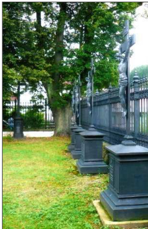
Pohled na hroby, které jsou na sche- matu označeny jako č. 4 až 10, foto 14. 9. 2011.