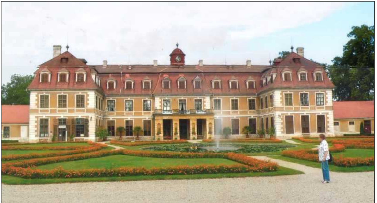
Rájec nad Svitavou. Nahoře je socha císaře Josefa II. z blanenské litiny (19. stol.), Obě foto 14. 9. 2011.