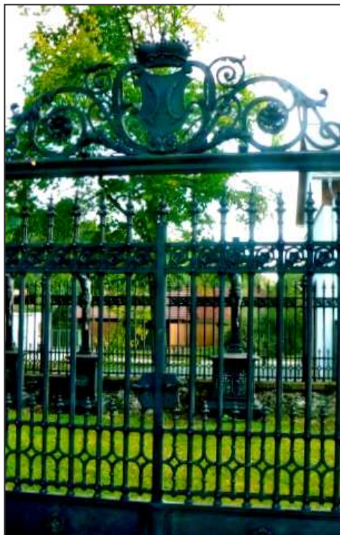
Vstupní brána se znamením Salmů, foto 15. 9. 2011.