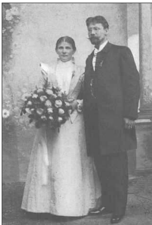
Svatební fotografie malířových rodičů, 1898